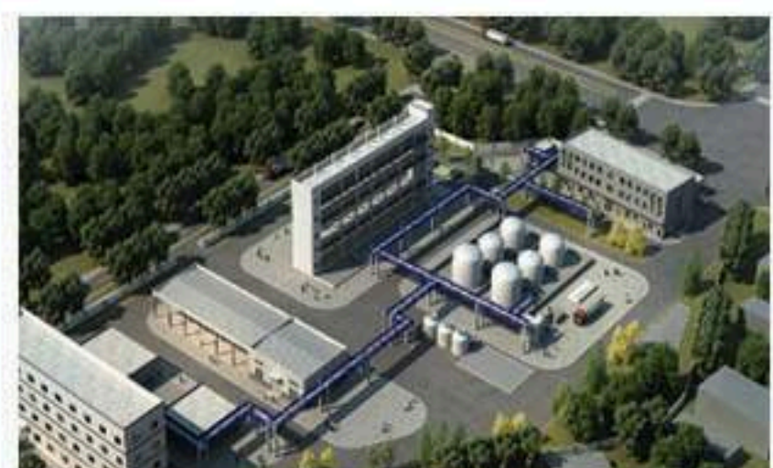
镇江：新纳环保公司38亩