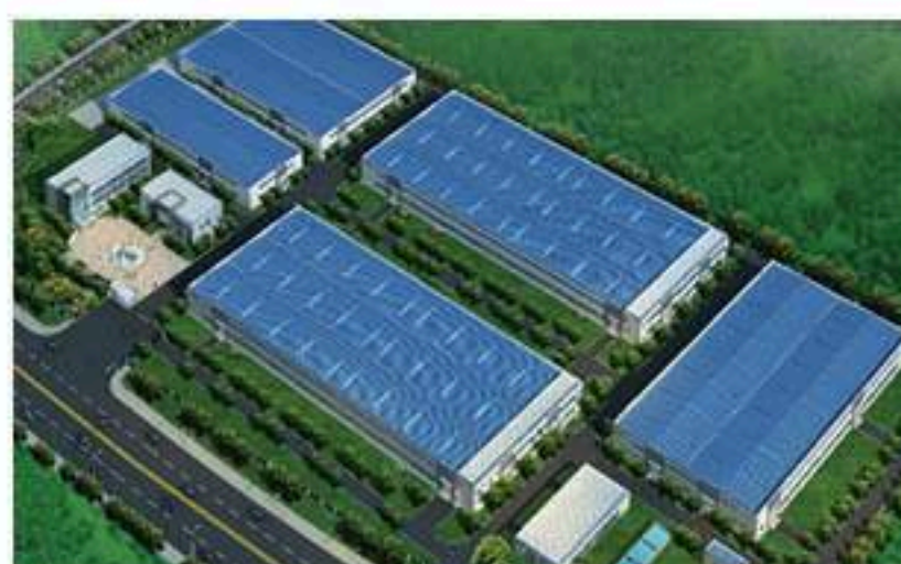
镇江：新纳材料公司107亩