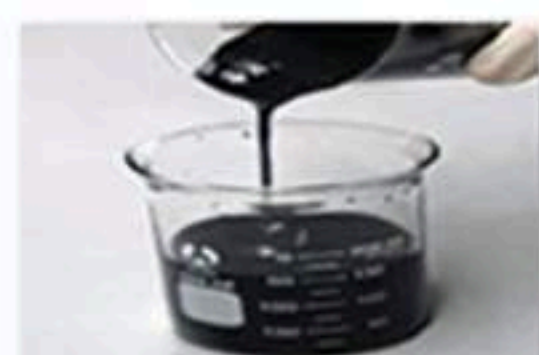
碳纳米管导电浆料