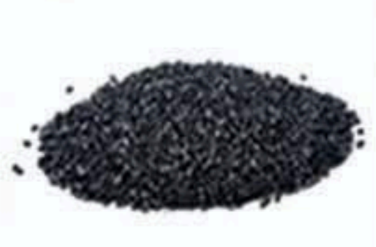
碳纳米管导电母粒