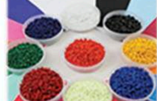
抗静电塑料/导电塑料