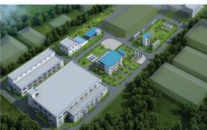
镇江：天奈科技主厂区85亩