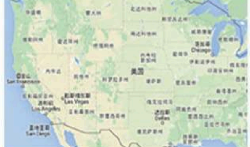
美国：内华达州项目