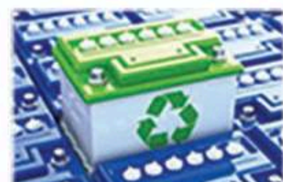
动力锂电池/数码电池